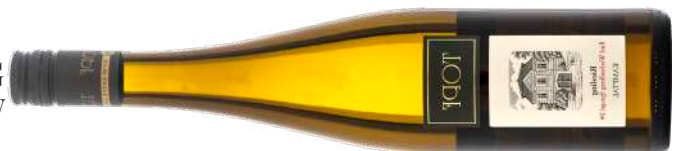
RIESLING RIED WECHSELBERG SPIEGEL | 1ÖTW