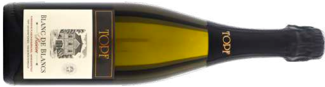
BLANC DE BLANC NV