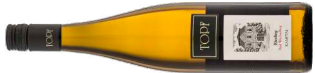
RIESLING RIED WECHSELBERG