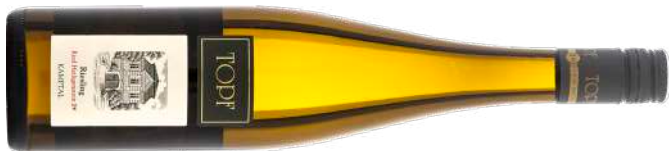
RIESLING RIED HEILIGENSTEIN | 1ÖTW