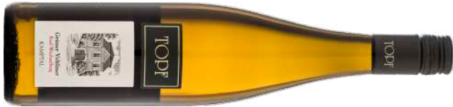
GRÜNER VELTLINER RIED WECHSELBERG