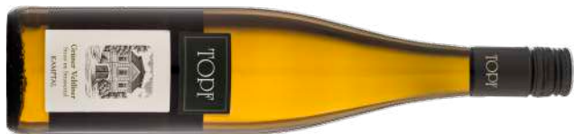
GRÜNER VELTLINER STRASS IM STRASSERTAL