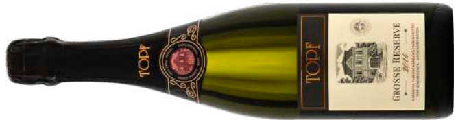
BRUT GROSSE RESERVE VINTAGE 2014