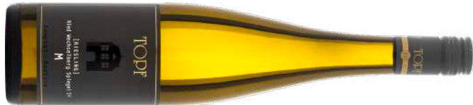
RIESLING RIED WECHSELBERG SPIEGEL | 1ÖTW