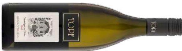
SAUVIGNON BLANC RIED HASEL