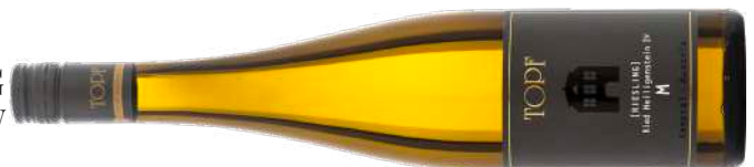
RIESLING RIED HEILIGENSTEIN | 1ÖTW