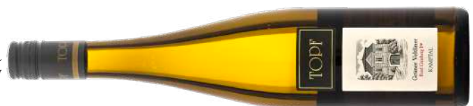
GRÜNER VELTLINER RIED GAISBERG | 1ÖTW