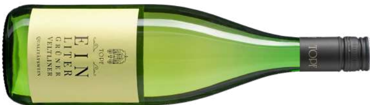
GRÜNER VELTLINER 1LT.