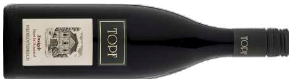
ZWEIGELT STRASS IM STRASSERTAL