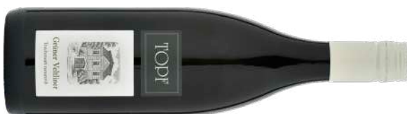
GRÜNER VELTLINER GRAPE JUICE