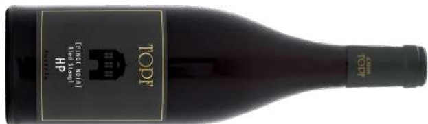
PINOT NOIR RIED STANGL "HP"