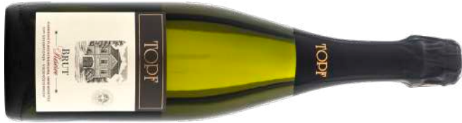
BRUT RESERVE NV