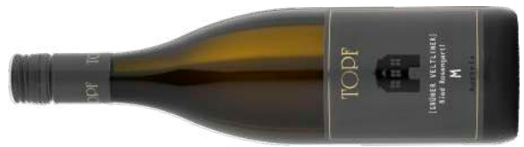
GRÜNER VELTLINER RIED ROSENGARTL "M"