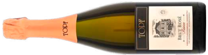
BRUT ROSÉ RESERVE NV